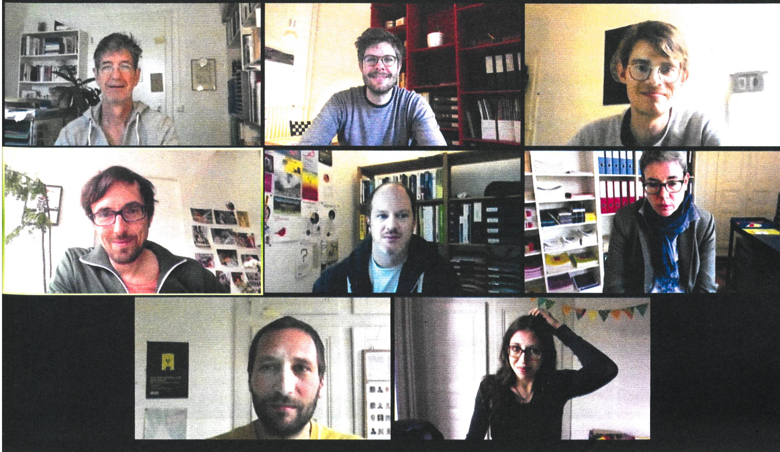
Die SES im Home-Office: Momentaufnahme aus einer der wöchentlichen Corona-bedingten Team-Videokonferenzen.

der ICT-Branche an den weltweiten Treibhausgasemissionen auf 3,7 % – also fast doppelt so schädlich wie der globale Anteil des zivilen Flugverkehrs (2 %). Eine Analyse von George Kamiya von der internationalen Energieagentur (IEA) 2 , korrigiert nun diese Aussage, indem sie eine Reihe von Fehlannahmen aufdeckt. Beispielsweise wurden viel zu hohe Datenübertragungsraten angenommen, und auch der Stromverbrauch der Rechenzentren wurde wesentlich zu hoch angesetzt, wie Dr. Rüdiger Paschotta in seinem Blog zusammenfasst. 3 Etliche Zahlen waren auch schlicht veraltet. Denn gemäss einer Faustregel verdoppelt sich die Effizienz von IT-Anwendungen alle 19 Monate 4 , was man vom Flugverkehr nicht behaupten kann. Beides sind Wachstumsmärkte.