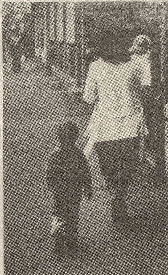
Morgens um halb sieben bringen die Mütter die Kinder in die Krippe.

Da es keinen pädagogischen Auftrag für Kripper gibt, werden Grundelemente der Kleinkindererziehung oft vernachlässigt. Mit den Kindern wird sehr selten gebastelt, obwohl dies zum Kennenlernen der Umwelt und zur Erprobung von verschiedenen Materialien von grosser Wichtigkeit ist. Auch das Erzählen wird vom Personal nicht sehr geschätzt. Bis 80% der Kinder in den Krippen sind Ausländerkinder. Gerade sie hätten es nötig, dass ihnen jemand in deutscher Sprache Geschichten erzählt, sie zum Fragen und Nachdenken animiert. Sprachliches Ausdrucksvermögen ist für den späteren Schulerfolg von entscheidender Bedeutung. Einrichtungen, die in jedem Kindergarten selbstverständlich sind, wie z.B. Kasperlietheater, Musikinstrumente und Konstruktionsspiele fehlen in den meisten Krippen. Anstatt die Kinder sinnvoll zu beschäftigen und in abwechslungsreichen Spielen ihr Können und ihre Phantasie zu fördern, werden sie einfach beaufsichtigt. Fehlverhalten werden mit Schlägen, Essensentzug und Isolierung (Keller, Estrich, Treppe) bestraft. Säuglingen verabreicht man Beruhigungssirup, wenn sie zu lange und zu laut weinen oder man legt sie in