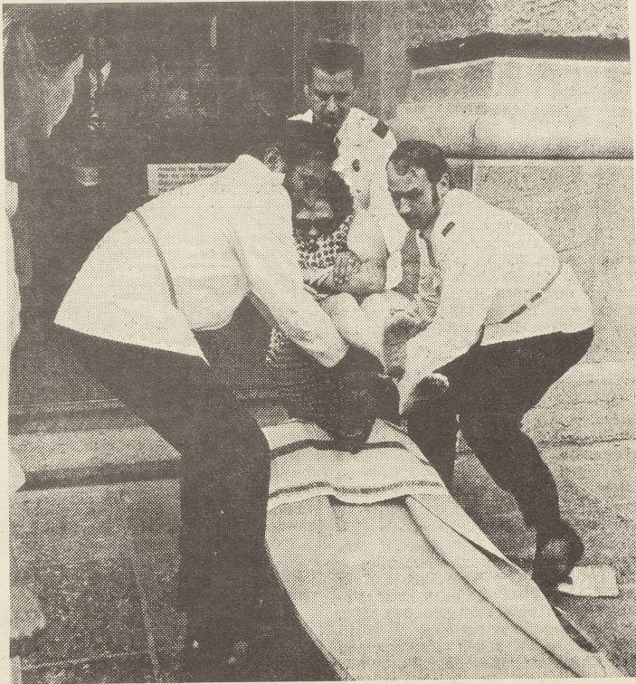
Die Invalide wird abtransportiert

Mitte Juni sass die invalide Sechzigjährige auf der Bundeshaustreppe und verteilte den Vorübergehenden einen hektographierten Brief an den "Sehr geehrten Herren Bundesrat Hürlimann". Ein Bundeshauskorrespondent beobachtete, wie ein Polizist ihr die Briefe aus der Hand riss und wie nachher drei Sanitätspolizisten die Frau abschleppten. Die Frau wohnt in Zürich. "Mein Name tut nichts zur Sache, ich will weder Mitleid noch Publizität, ich will nur eine gerechte AHV für meine Mitschwestern und mich." Es geht um die Benachteiligung der ledigen Frau, "dem schwächsten Glied unter den Rentnern", "Eine verheiratete Frau kann 20 Jahre jünger sein als ihr Mann, dann kriegt sie schon mit 45 Jahren eine Zusatzrente. Ist die Frau aber 10 Jahre älter als ihr Mann, erhält sie, auch wenn sie keine Beiträge an die AHV bezahlt hat, eine einfache Altersrente. Ihr Mann bringt den vollen Zahltag nach Hause, und bis der Mann das Rentenalter erreicht hat, hat die Frau von der AHV bereits Fr. 78 000 erhalten.... Die Männer verdienen im Durchschnitt 50 % mehr Lohn als die Frauen... Den Witwen wird eine Rente ausbezahlt nach den Beiträgen der Männer, also mehr als der ledigen Frau. Eine Witwe kann zudem schon ab 45 Jahren ohne eigene Beiträge eine höhere Rente beziehen als ich je bekommen werde. Ist sie gut situiert und hat es nicht nötig zu arbeiten, muss sie auch weiterhin keine Beiträge bezahlen, während ich mit meiner kärglichen IV-Rente noch einen Obolus abgeben muss." Und dann