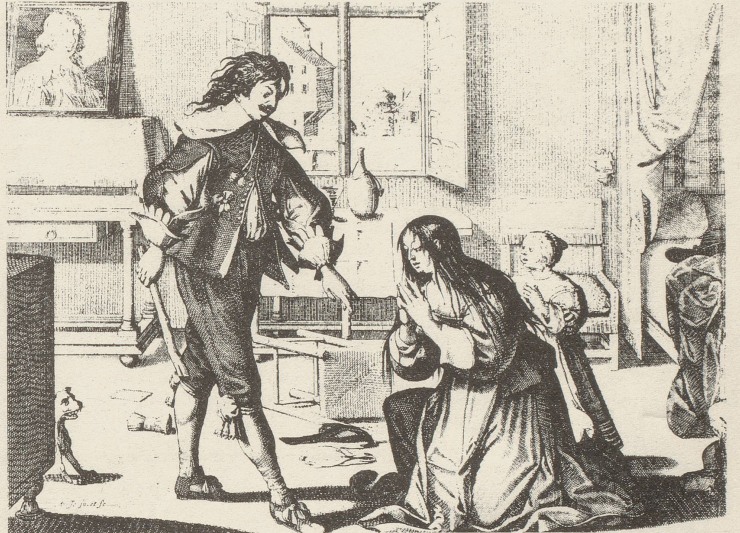
Die Zeiten sind endgültig vorbei

das gleiche Entscheidungsrecht wie der Mann. Beide müssen gemeinsam den Wohnsitz bestimmen, der Mann kann nicht ohne Zustimmung der Frau einen Teil des Besitzes, d.B. die Möbel, kaufen oder verkaufen. Auch mit Befehlen, wie "Dass du arbeitest, kommt gar nicht in Frage!" ist jetzt endlich Schluss. Viele dieser Neuerungen halten aber eigentlich nur das fest, was in den meisten Ehen ohnehin der Fall ist. Denn wieviele Männer können ihren Frauen die Berufstätigkeit verbieten, wenn doch die Familien dringend auf das Einkommen der Frau angewiesen sind? Trotzdem ist gerade diese Neuerung des Gesetzes wichtig, denn sie hindert den Mann, über seine Frau zu verfügen. Die formale Gleichstellung von Mann und Frau wird auch in den Artikeln vollzogen, die sich mit dem Besitz des Ehepaares befassen. (Ueber dieses Thema wird es einen ausführlichen Artikel in einer der nächsten Nummern geben.)