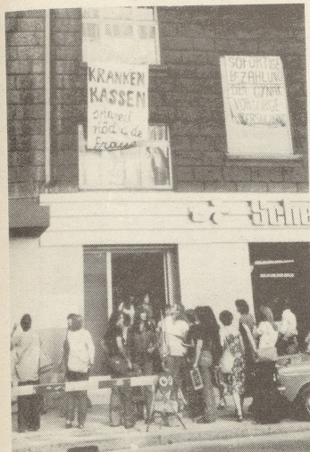
PFZ, FBB und Spitalgruppe Winterthur reichten am 1. Juli mit über 4000 Unterschriften eine Petition ans kantonale Krankenkassenkonkordat ein, welches uns auf Ende August zu einem Informationsgespräch einlud.