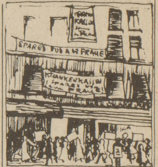
Protest an Krankenkassen-Hausfassade: «Spared nöd a de Fraue»

Über 4000 Frauen und Männer haben das Protestschreiben unterstützt. Wie uns die Reaktion der angesprochenen Leute eindeutig zeigt, ist die Empörung in der Bevölkerung über diese kurzsichtige und asoziale Massnahme gross. Es ist bekannt, wie wichtig die jährliche Untersuchung für die Frauen ist, um eventuelle Veränderungen im Frühstadium zu erkennen, und dank der frühen Diagnose eine