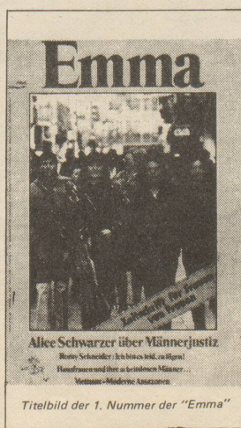
Titelbild der 1. Nummer der "Emma"