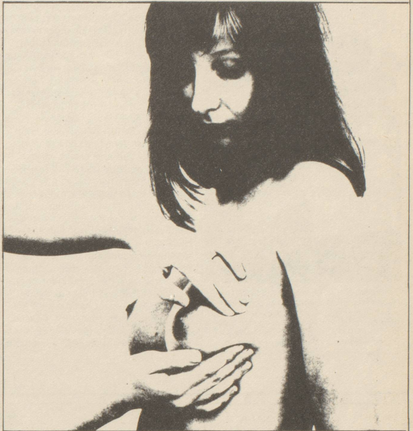
Die Brustuntersuchung kann man selber machen. Ihr Arzt soll Ihnen zeigen wie!

Viele Frauen, die den Fragebogen ausgefüllt haben, neigten Verhütungsmittel, in den meisten Fällen die Pille. Selten informieren die Frauenärzte