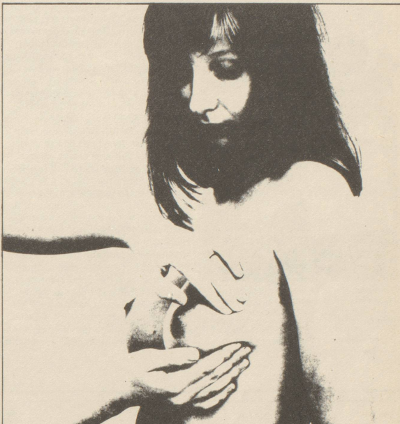
Die Brustuntersuchung kann man selber machen. Ihr Arzt soll Ihnen zeigen wie!

Viele Frauen, die den Fragebogen ausgefüllt haben, neigten Verhütungsmittel, in den meisten Fällen die Pille. Selten informieren die Frauenärzte