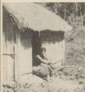
Wie leben die Paï-Indianer?

Ich habe an der Uni Ethnologie und Urgeschichte studiert mit dem Ziel, einmal in die Dritte Welt, wenn möglich nach Südamerika, zu gehen. Zuerst aus wissenschaftlichen Motiven. Nachdem ich gesehen habe, dass man Völker nicht einfach studieren kann, wenn sie gleichzeitig vor der Ausrottung stehen, habe ich mich entschlossen, einen Weg zu suchen, wie ich mein Interesse an fremden Kulturen mit einer vernünftigen Hilfe verbinden könnte. Konkret hat sich dann für mich und meinen Mann dieses Projekt in Paraguay angeboten.