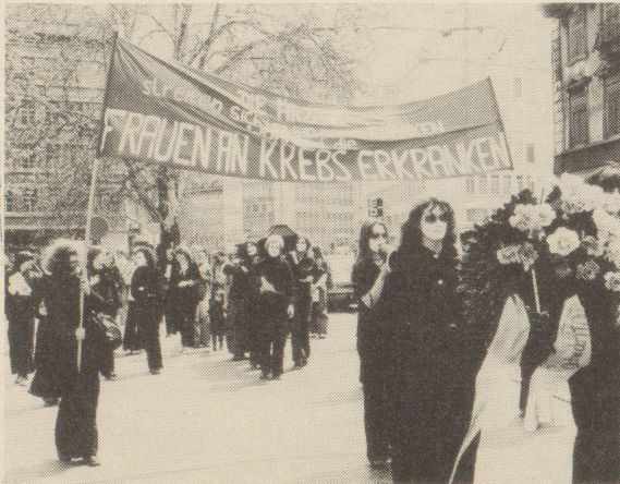
Unsere Muttertagsaktion in Zürich

Zu dieser Problematik vgl. unsere Broschüre "Lieber ein Mann und gesund als eine Frau und krank"!