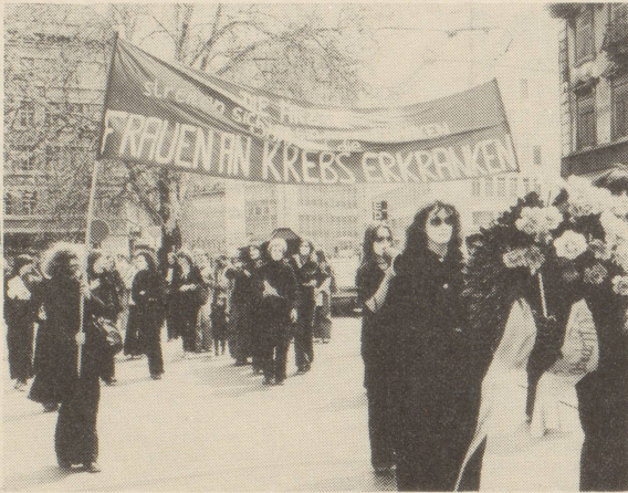
Unsere Muttertagsaktion in Zürich

Zu dieser Problematik vgl. unsere Broschüre "Lieber ein Mann und gesund als eine Frau und krank"!