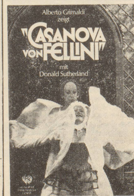
Noch einmal: Casanova

Wir Frauen in der Redaktion waren uns keineswegs einig über den Film "Casanova" von Fellini. Darum haben wir beschlossen unsere Leserinnen an der Diskussion teilnehmen zu lassen. Während wir in der Mai-Nummer der "Emanzipation" die Meinung: "der Film zeigt ein Stück Realität, er ist empfehlenswert" zu Worte kommen liessen, wollen wir jetzt einer Gegenposition Platz geben. Die Autorin sagt: "Früher war ich glühende Fellini-Verehrerin".