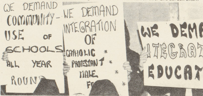
Auf Plakaten fordern irische Frauen die Aufhebung der nach Konfession und Geschlechtern getrennten Schulbildung

Nur verhältnismässig wenige Frauen erlangen