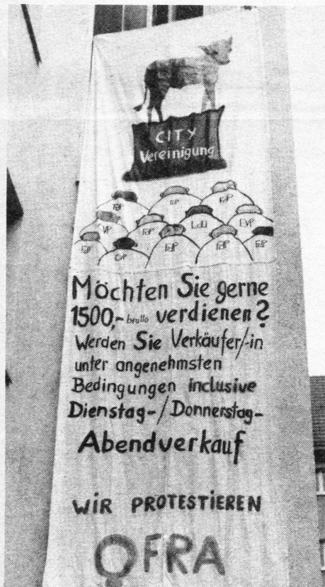
VERKÄUFERINNEN – ABENDVERKAUF