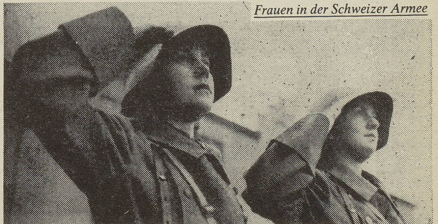
Frauen in der Schweizer Armee

Was aber sollen Friedensfrauen dann tun? Etwas, was so einfach, wirkungsvoll und unschlagbar ist, unschlagbar vor allem gegenüber graue Theorie über Sachzwänge, ideologische Parteilichkeit, verwissenschaftlichte Aufrechnung von wirtschaftlichen Notwendigkeiten und geistige Landesverteidigung. Die Parole, warum sollen Frauen für Männerwerte und Männerhirngespinnste einstehen, ist heute wahrhaftig kein ‘blosser’ Emanzenspruch mehr und auch nicht lächerlich, denn wir müssen viel, wenn nicht mehr bezahlen, leiden, durchstehen, wenn die anonymisierten Kampfahne aufeinander einschlagen. Denn Kriege haben sich strategisch verändert, sie werden nicht mehr an Fronten