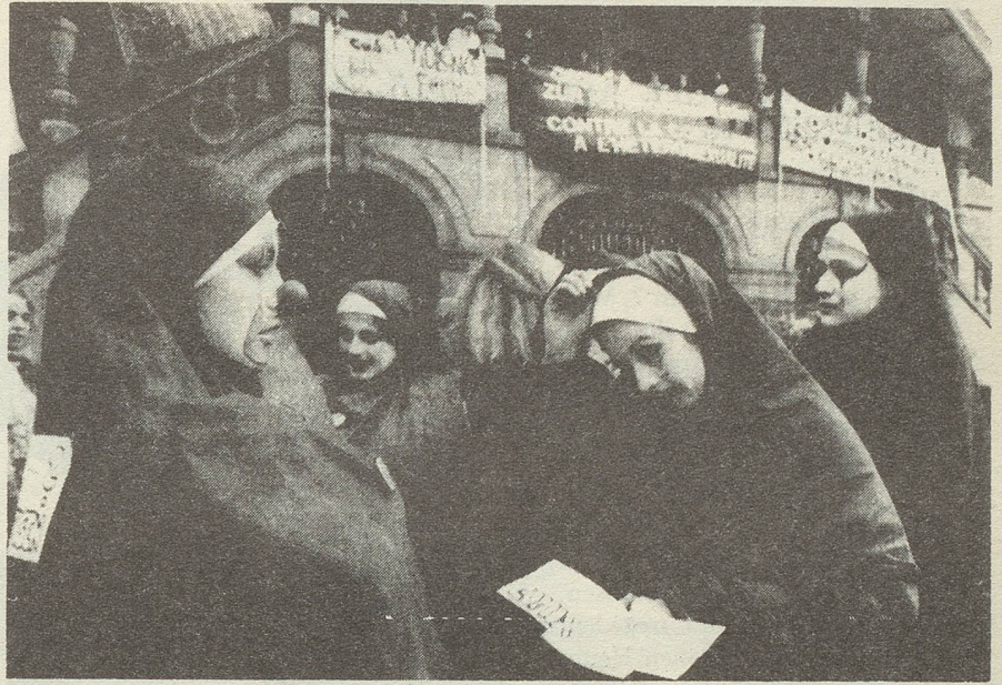
In Fribourg waren ca. 300 Frauen dem Aufruf der Radikalfeministinnen gefolgt und demonstrierten ohne Männer.