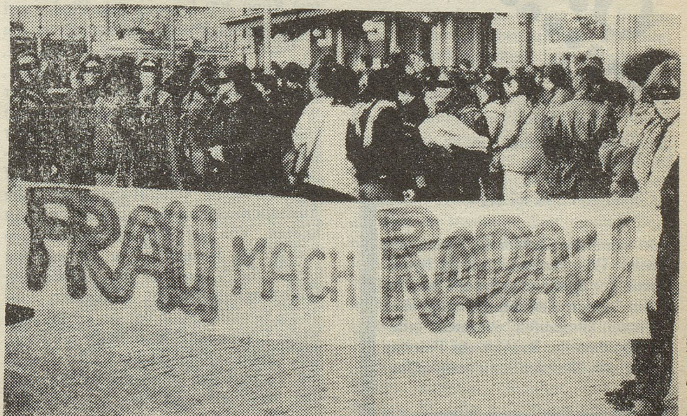
Am Montagnachmittag feierten in Zürich ca. 300 Frauen den internationalen Frauentag 'auf ihre Weise'. Mit Buttersäure und Steinen zeigten sie erfolgreich, was sie von Sex-Läden und Sex-Kinos halten.