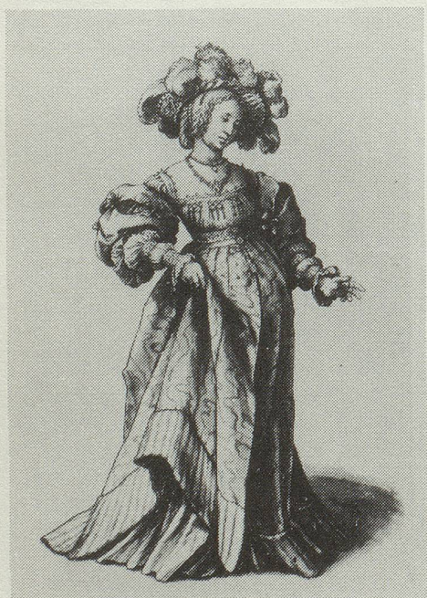
Junge Frau in Basler Tracht von Hans Holbein d.J. (1497/98-1543), Zeichnung aus dem Kupferstichkabinett in Basel.

Merkwürdig, wie wenige von ihnen schwanger sind. (aus: Phyllis Chesler, Über Männer, Hamburg 1979, S.80)