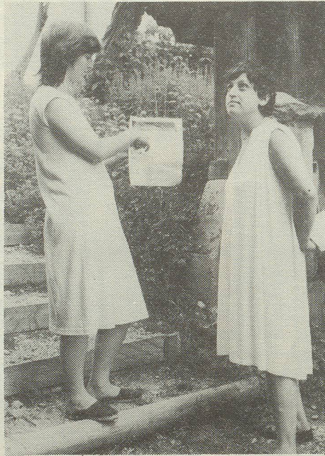
B. wird belehrt...

D: "Für mich ist der Kinderwunsch immer in Verbindung mit einem Mann gekommen. Beim Orgasmus hatte ich machmal den Wunsch, dass gerade jetzt ein Kind entstehen sollte. Für mich muss aber der Wunsch nach einem Kind nicht begründet werden, er ist einfach da, archaisch."