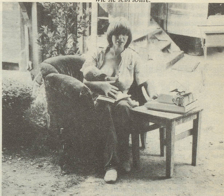
...und so sehen wir die ideale Mutter, wie sie sein sollte.

'Rabenmutter' und musste mir das z'Vieri immer selbst machen. Andererseits ist meine Mutter eine völlig unemanzipierte Frau. Sie hat einfach dem Mann im Geschäft geholfen, ist aber emotional völlig abhängig von ihm, haarsträubend."