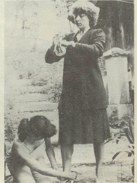
C. zieht ihrer Mutter die Schuhe an...

Wir haben nicht nur diskutiert, sondern auch versucht, unser Verhältnis zu unseren Müttern ins Bild umzusetzen. Wir haben mit Hilfe einer Statuendarstellung unsere Mutter und uns selbst modelliert. Die Darstellerinnen sind also nicht identisch mit den Personen, die dargestellt werden.