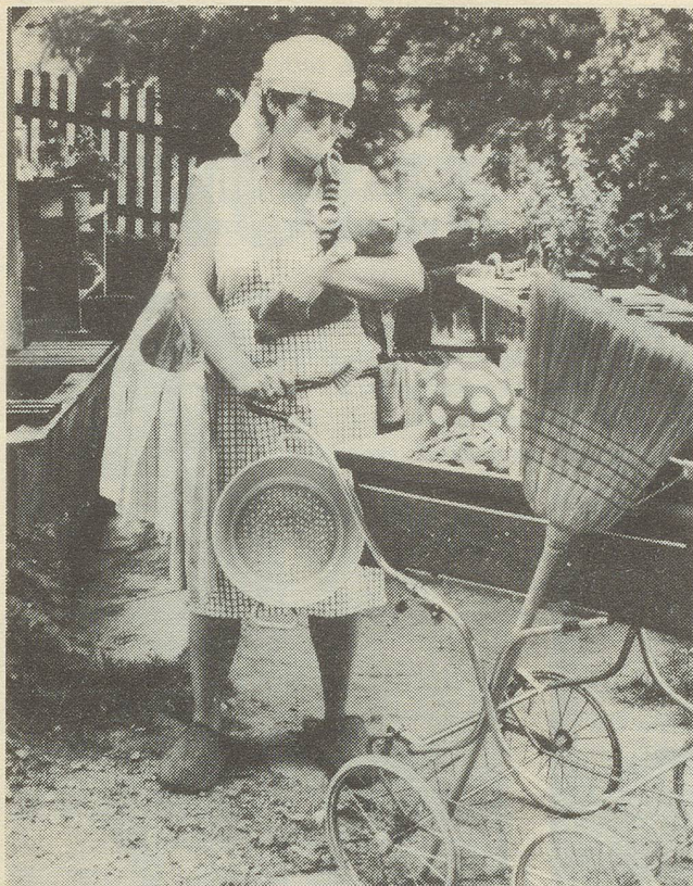
So sehen wir die Mütter, wie sie heute real sind...