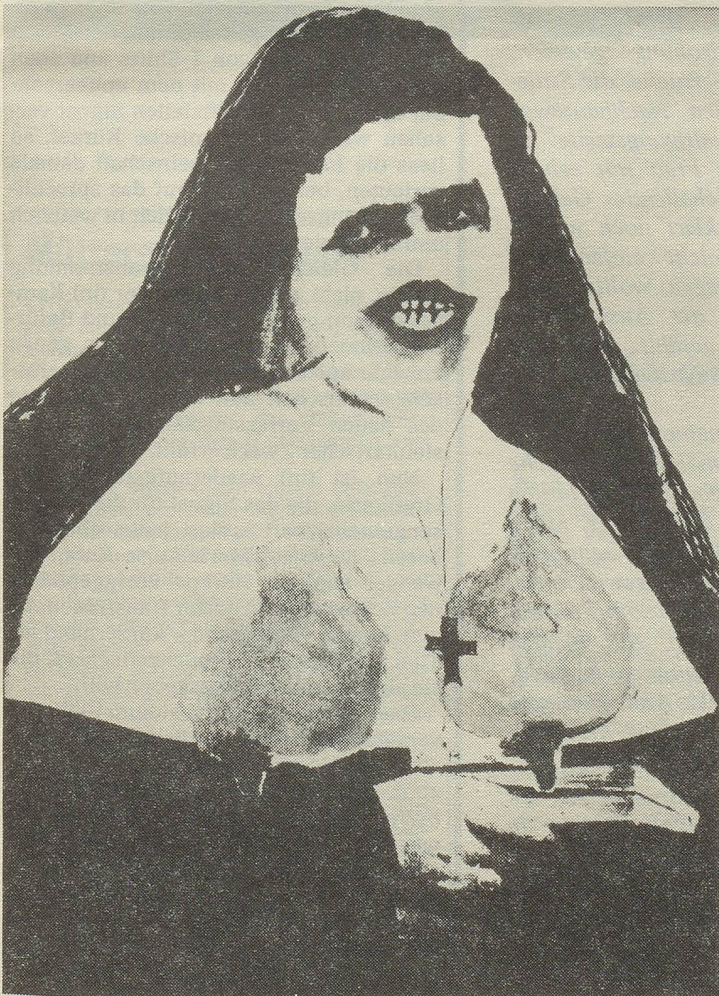
'Devils', Lithographie von Hjordis Dreschel (Plakat zu Ken Russel's Film 'The Devils')