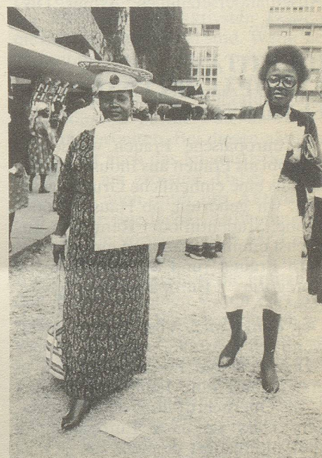
Fortsetzung der Workshops auf der Strasse