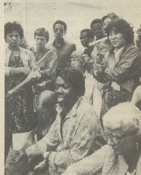
Männer als aufmerksame Zuhörer in den hinteren Rängen (hier eine Auseinandersetzung über Polygamie)