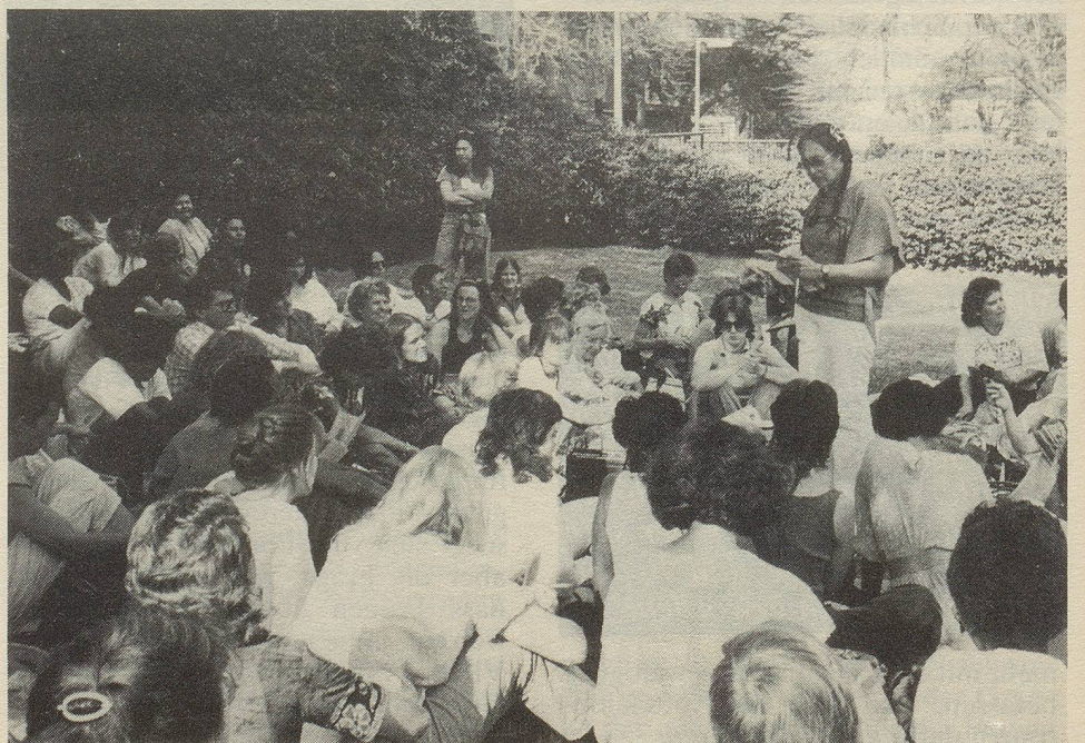
Nordamerikanische "Indianerinnen" vor hauptsächlich weissem Publikum: "Überleben in den 80er-Jahren"