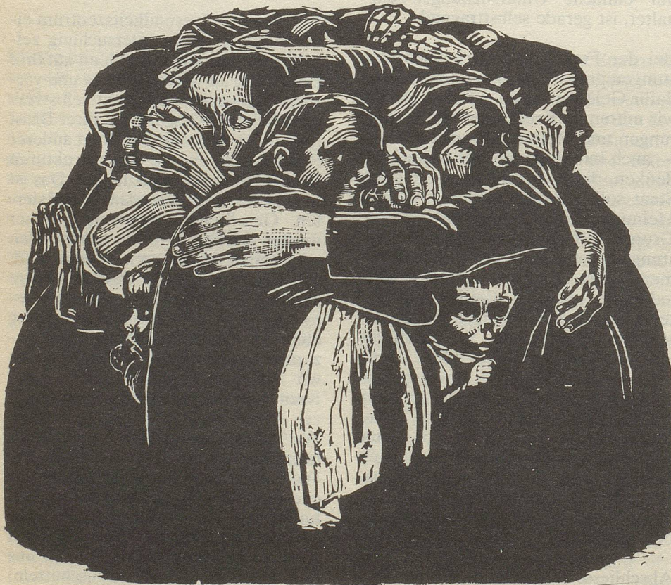
Der Turm der Mütter.

Berühmt geworden ist ihre Antwort an Richard Dehmel (der noch einmal Kriegsfreiwillige aufrufen wollte, die Ende 1918 Deutschlands Ehre retten sollten). Sie antwortete damals in einem Offenen Brief an Richard Dehmel (am 30. Oktober 1918): "...Man hat tief umgelernt in diesen vier Jah-