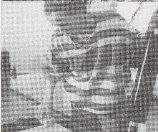
Farbe einwalzen mit Stein