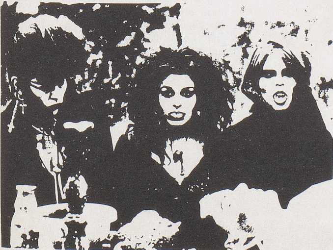
Bad Blood for the Vampire