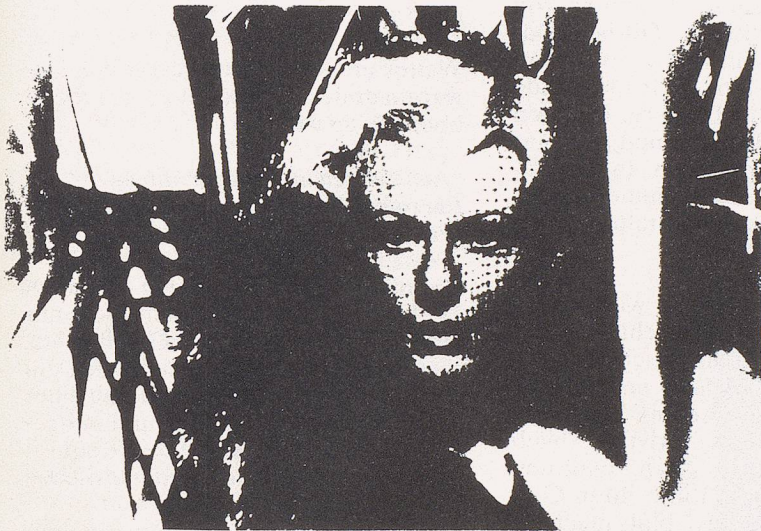
Le Rouge aux Lèvres

Zum dritten Mal finden in diesem Jahr anlässlich des Internationalen Tages der Frau im März in verschiedenen Schweizerstädten die Frauenfilmtage statt. Auf der Rückseite dieser emanzipation sind weitere Angaben zum Programm zu finden. Bei der Themenwahl sind wir dieses Jahr vor demselben Problem gestanden wie immer: Es ist unmöglich, sowohl thematisch zu arbeiten, als auch ausschliesslich Filme von Frauen zu zeigen. So haben wir uns heuer für ein "Frauenthema" entschieden: Die Nonne. Sie hat uns fasziniert, weil sie durch ihr Gewand – das heisst, durch ihre uniforme Bekleidung – in gewissem Sinne das weibliche Pendant zum Soldaten darstellt: Nicht mehr das Individuum ist in erster Linie wichtig, sondern die Zuordnungen, die in Anbetracht einer wie auch immer gearteten Uniform gemacht werden. Wir hatten das Glück, bei den Nachforschungen zum Thema auf eine Broschüre zu stossen: "Schwesterlich, keusch und ohne Makel" von Samanta Maria. Die Autorin hat sich eingehend mit Film-Nonnen beschäftigt, und wir konnten von ihrem grossen Wissen profitieren. Doch – nicht zuletzt um nicht brav oder langweilig zu werden – haben wir einen Gegenpol gesucht, ei-