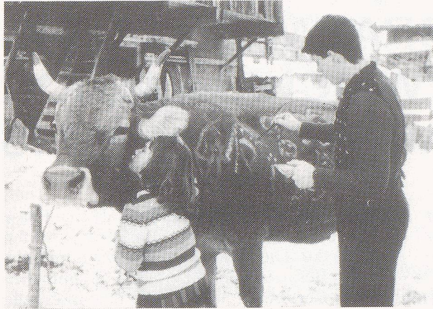
“La rusnà pearsa“ von Dino Simonett, Schweiz