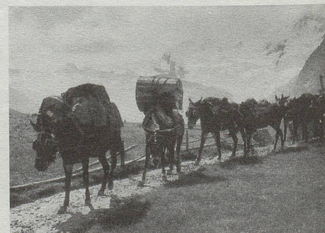
Komm mit ins Wallis – Maultierpost von Saas-Fee nach Saas-Grund in den Dreissigerjahren. (Printed in Switzerland – Imprimé en Suisse)

Noch ein kulturelles PS: Im neuen Ortseum von Raron, jenem hübschen Städtchen nahe Visp, in dem Rilke begraben liegt, hat Iris von Rothen ein Zimmer für sich allein erhalten. Sie lebte und arbeitete halb in Raron, halb in Basel. (Museum auf der Burg, vom 1. Mai bis 30. September täglich geöffnet von 10–16 h, im April und Oktober nach Voranmeldung, Tel. 028/44 29 69.)