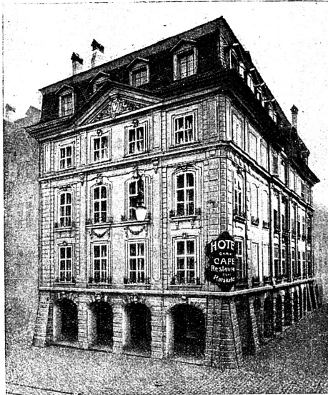
Hotel und Café-Restaurant Ratskeller Vereinslokal der Ortsgruppe Bern

entstand das sehr malerische Nydeckquartier, mit der alten Nydeckkirche zur Mitte, wie das Titelbild zeigt, welches jedem Stadtfremden zur Besichtigung empfohlen wird. Eine Tafel an der Kirche besagt, dass die Grundmauern der Kirche der alten Burg Nydeck angehörten. Jenseits der Aare, über welche die Nydeckbrücke führt, befindet sich der Bärengraben, der die Wappentiere der Bundestadt enthält, zur Zeit deren 12. Im mittleren Strassenzuge der Altstadt bildeten sich die alten noch heute bestehenden Zunfthäuser, gekennzeichnet durch die Wappentafeln an der Hausfassade. Auch unser Vereinslokal, das Hotel-Restaurant Ratskeller, das sich in dieser Strasse befindet, hat historischen Charakter. Es war das Haus des letzten bernischen Vogtes. Zu mittelalterl. Zeit wurden hier (Kreuzgasse) öffentlich die