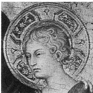
Simone Martini (1280–1344): Der zwölfjährige Jesus im Tempel (Ausschnitt)

so kritisch auszulegen vermag – genau kennen muss. Scorsese hält sich ziemlich genau – manchmal sogar wörtlich – an den Roman des griechisch-orthodoxen Schriftstellers Nikos Kazantzakis (1883–1957), der zu den grossen griechischen Autoren des 20. Jahrhunderts gehört. Kazantzakis setzte sich in mehreren Roma-