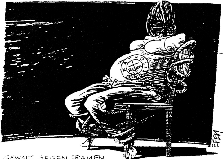
GEWALT BEGEGEN FRAUEN