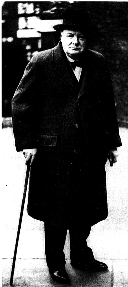
Winston Churchill begibt sich im April 1940, mit der Koordinierung der Kriegführung betraut, nach Downing Street 10.

kennenlernen und nichts wäre leichter, als das in die Wege zu leiten. Hitler kam jeden Tag gegen 17 Uhr in das Hotel und er würde sich sicherlich sehr freuen, mich zu sehen.»