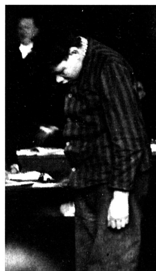
Rudolf Augsteins Einzeltäter: Marinus van der Lubbe

«Jedem Deutschen ist klar, dass die Männer, denen das deutsche Volk seine Errettung vor dem bolschewistischen Chaos verdankt und die es einer inneren Erneuerung und Gesundung entgegenführen, einer solchen verbrecherischen Gesinnung, wie sie diese Tat verriet, niemals fähig waren. Der Senat hält es daher auch für unter der Würde eines deutschen Gerichts, auf die niedrigen Verdächtigungen, die in dieser Beziehung von vaterlandslosen Leuten in Schmähbriefen (Braunbuch) im Dienste einer Lügenpropaganda ausgesprochen sind, die sich selbst richtet, überhaupt nur einzugehen.»