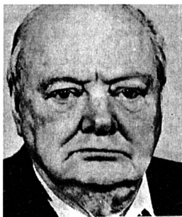
Die Bitternis seines Sieges steht Winston Churchill ins Gesicht geschrieben.

«Augstein, von Komplexen geplagt, ist in der deutschen Politik und Publizistik das, was der listig-verschlagene Loki in der germanischen Sagen- und Götterwelt ist. Zudem hat sich beim «Spiegel» und bei Augstein nicht nur einmal die Frage gestellt, in wessen Auftrag sie arbeiten, vor allem dann, wenn sie ihren hemmungslosen Kampf gegen mich führten. Der Prozess zwischen dem «Spiegel» und dem englischen Unternehmer James Goldsmith hat dazu interessante Informationen zutage gefördert. Es wurde festgestellt, dass der «Spiegel» Material des sowjetischen Geheimdienstes verwendet hat, dass dies aber nicht bewusst geschehen sei.»