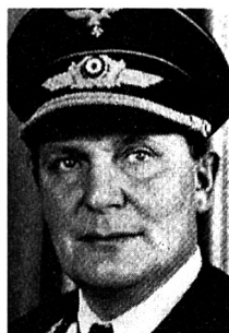
Hermann Göring: Lügner, Morphinist, Pyromane

«Die Auslandspropagandisten haben nicht einmal dem dümmsten Leser klar machen können, dass zum mindesten ein Schatten eines Beweises erbracht worden wäre. Es wird behauptet, dass der Gang hier zwischen dem Reichstag und meinem Palais drüben durch meine SA-Leute benutzt worden wäre, um den Reichstag anstecken zu lassen. Ich erinnere daran, dass die Welpresse damals in sensationellen Überschriften ‚Das Geheimnis des Reichstagsbrandes entdeckt‘, ‚Unterirdischer Gang zwischen dem Palais des Reichstagspräsidenten und dem Reichstag aufgedeckt‘ usw. über die Sache schrieb. Ich brauche wohl hier nicht zu betonen – es ist ja durch den Lokaltermin mittlerweile erhärtet –, dass dieser sehr ‚geheimnisvolle‘ Gang jedem Menschen, der hier auf der Strasse geht und durch den Luftschacht hinuntersieht, bekannt sein musste. Es ist der Gang, durch den überhaupt der gesamte Verkehr zwischen dem Maschinenhaus und dem Reichstag tagtäglich hindurchgeht. Er endet auch nicht bei mir in meiner Wohnung, sondern er endet hinten im Maschinenhaus.»