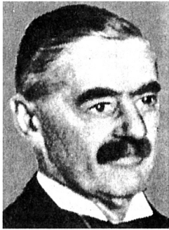
Neville Chamberlain 1869–1940

«Peace for our time!» Aber, wusste Churchill: «Chamberlain kehrte nach England zurück. Bei seiner Landung in Heston schwenkte er die gemeinsame Erklärung, deren Unterzeichnung er von Hitler erreicht hatte, in der Hand und las sie den Würdenträgern und andern, die ihn empfangen, vor. Als sein Auto durch die am Flugplatz versammelte jubelnde Menge fuhr, sagte er zu Halifax, der neben ihm sass: ‚Das alles wird in drei Monaten vorüber sein.‘»