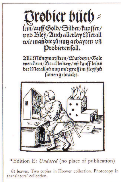
2 Undatierte Ausgabe des «Probierrbüchlein». Erstausgabe der zweiten Serie, abgeleitet aus der Magdeburger Urausgabe.

Das von der Eisen-Bibliothek erworbene «Probierrbüchlein» stellt ein weiteres bisher unbekanntes Exemplar der Ausgabe dar, von der Herbert Hoover zwei Exemplare besitzt. (Bild 3.) Diese