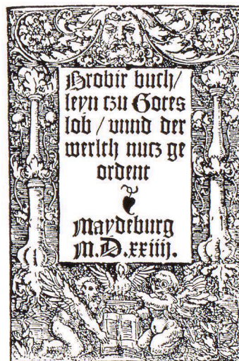
*Edition A: 1524 (Magdeburg)

Ferner ist ein Nachdruck der Magdeburger Ausgabe aus dem Jahre 1527 bekannt, und eine datierte Ausgabe, gedruckt in Strassburg 1530. Eine weitere datierte Ausgabe wurde im Jahre 1534 bei Heinrich Steyner in Augsburg gedruckt.