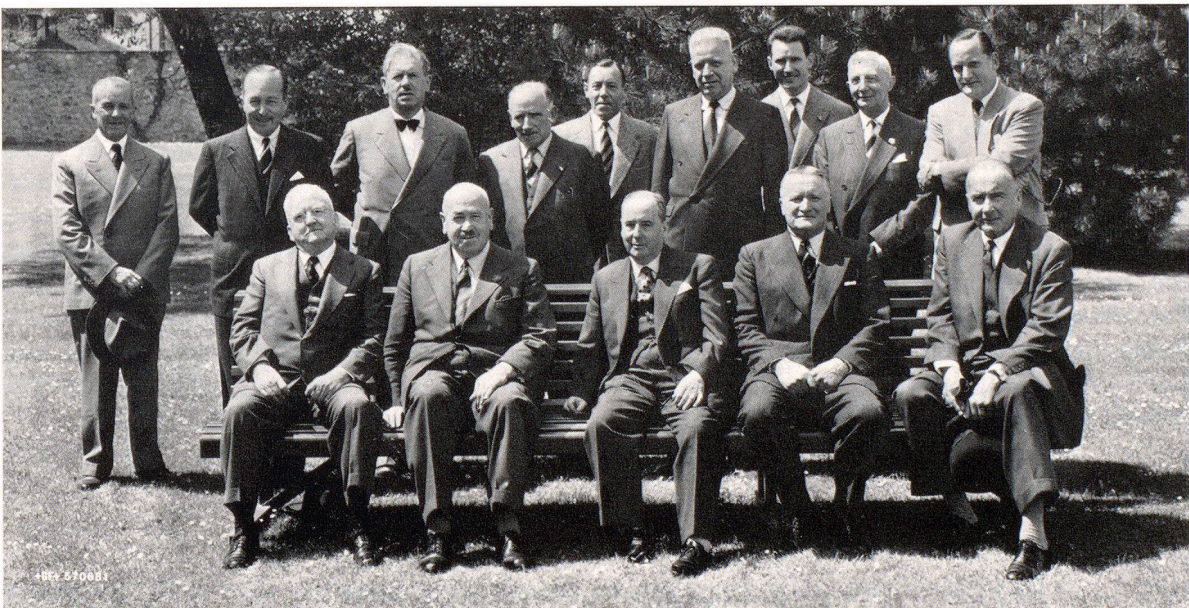
Stiftungsrat und Mitarbeiter

Am 14. Mai dieses Jahres trafen sich im Paradies die Mitglieder des Stiftungsrates, aus den Vereinigten Staaten, England, Frankreich, Deutschland, Italien und der Schweiz, zu einer Arbeitstagung mit den Schaffhauser Organen der Eisenbibliothek. Es war dies eine willkommene Gelegenheit, an Ort und Stelle einen allen erwünschten Einblick zu vermitteln in die Organisation und die bisherige Tätigkeit der Bibliothek, die nun rund 18 000 Bände in 15 Sprachen umfasst. Der Bücherbestand konnte in der kurzen Zeit seit der Gründung mengenmässig und qualitativ, gegen alle düsteren Prophezeiungen, auf ein beachtenswertes Niveau gebracht werden. Den begeisterten Helfern seien hier Dank und Anerkennung ausgesprochen.