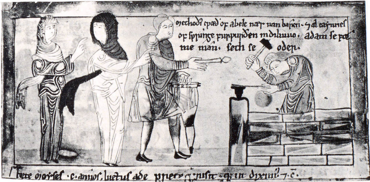
Schubert Taf. VII. Angelsächsische Schmiede (Miniatur aus einer Handschrift des 11. Jahrhunderts im Britischen Museum)

Zur Zeit, als der führende deutsche Historiker Leopold von Ranke (1795—1886) seine Weltgeschichte zu schreiben begann, bereitete sich Ludwig Beck (1841—1918) darauf vor, «Die Geschichte des Eisens in technischer und kulturgeschichtlicher Beziehung» als Weltgeschichte des Eisens zu verfassen. Der Tod nahm Ranke 1886 die Feder aus der Hand, nachdem es ihm gelungen war, sechs Bände seines geplanten Werkes zu veröffentlichen und bis ins 10. nachchristliche Jahrhundert vorzustossen. Ludwig Beck war es vergönnt, seine Geschichte des Eisens abzuschliessen; in fünf Bänden mit über 6000 Seiten schilderte er die Geschichte des Eisens bei allen Völkern von der Urzeit bis in seine Gegenwart. Die Gesamtschau, die Ranke und Beck für ihre Themen erstrebten, ist in ihrer Parallelität nicht zufällig; sie entsprach dem geistigen We-