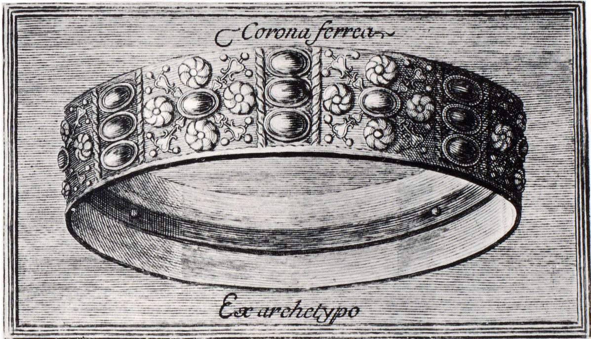
Die eiserne Krone aus Justus Fontaninus, Dissertatio de Corona Ferrea Langobardorum

Auf Fontaninus stützte sich der Verfasser einer zweiten Publikation, Angelo Bellani , Chorherr in Monza, der seine 1819 erschienene Schrift «La Corona Ferrea del Regno d'Italia» dem Vizekönig des Lombardo-Venezianischen Königreiches, dem österreichischen Erzherzog Rainer, widmete. Der Verfasser bezeichnet sein Werk als «Memoria apologetica» , und er polemisiert heftig gegen Zweifler und Kritiker, die er als «detrattori del Sacro Diadema» apostrophiert. Als Bürger von Monza betrachtet er die eiser-