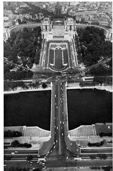
Blick vom Eiffelturm

Gegen Ende der Bauarbeiten waren 250 Arbeiter eingesetzt, jedoch nur 60 von ihnen waren von Anfang bis Ende der Bauzeit – die insgesamt 794 Tage dauerte – dabei.