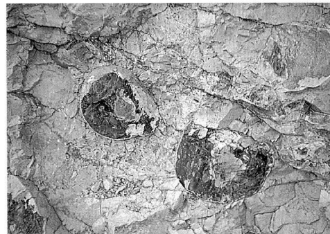
Eingelagerte Hornsteinknollen im Malmkalk bei Tremosine am Gardasee (Oberitalien). Tektonisch stark mit Druckrissen gestörte Feuersteinknollen.