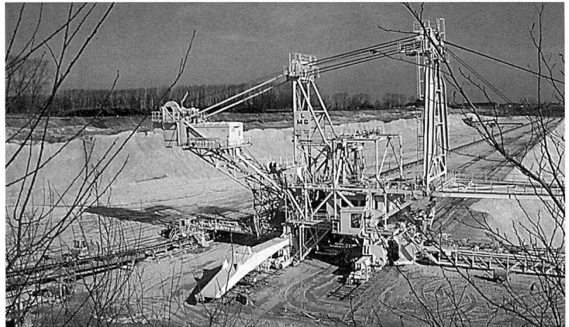
Kreidegrube von Lägerdorf bei Schleswig-Stein (BRD), mit Feuersteineinlagerungen.

Es ist für die zukünftige geoarchäologische Forschung zu wünschen, dass der Herkunft der Feuersteingeräte in den Siedlungsgrabungen vermehrt Achtung geschenkt wird. Es wäre auch zu begrüßen, vermehrt gute Verbindungen zwischen geologischen Fachleuten und Archäologen herstellen zu können. ■