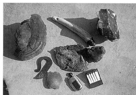
Feuerstahl mit Zunder bis zum heutigen Feuerzeug.