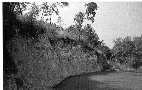
Jura-Malmkalkaufschluss mit Hornsteinknollen.