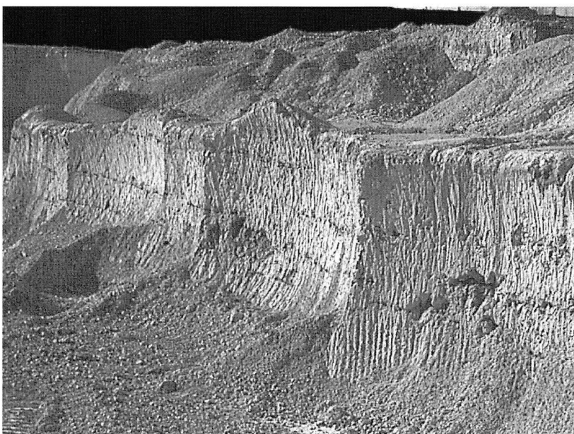
Kreidefeuersteinlagen in der Schreibkreide von Mön.

Auf dies möchte ich aber nicht weiter eingehen, sondern mich mit den geoarchäologischen Aspekten befassen.