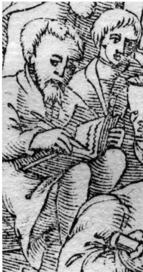
Abbildung 3: Ausschnitt aus Abb. 2.

scheidet. Das elfte weist die Wege, wie man Silber von Kupfer trennt. Das zwölfte gibt Hinweise für die Gewinnung von Salz, Soda, Alaun, Vitriol, Schwefel, Bitumen und Glas.»