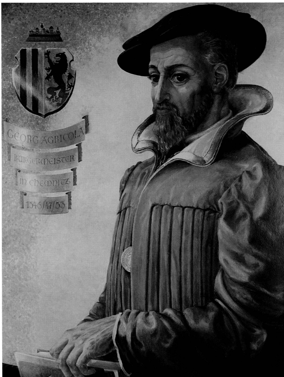
Doktor Georgius Agricola, 1494 – 1555