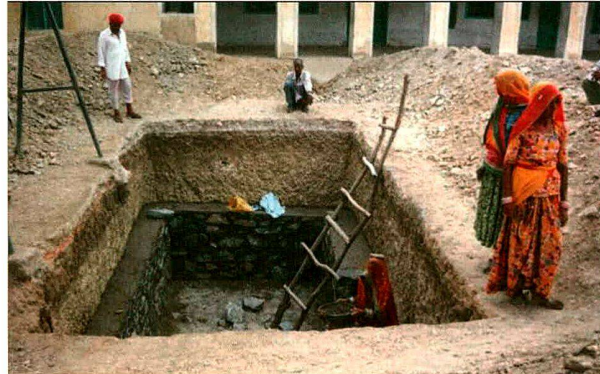
Sikkim (2005): Der Bau von Regenwasserauffangbecken bildet einen der Schwerpunkte von «Clean Water». Projektpartner: Barefoot College (Indien).

Äusserst wichtig und nicht zu unterschätzen ist auch die Bedeutung der lokalen Wasserkomitees. Natürlich kommt