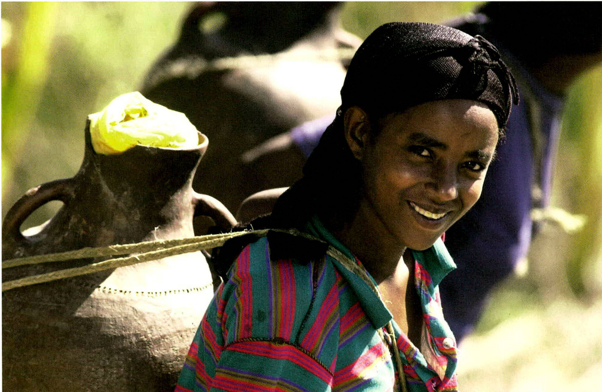
Äthiopien (2003); Projektpartner: Menschen für Menschen.