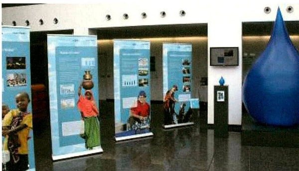
Mettmann (2008): Wanderausstellung von «Clean Water» zu Besuch in unserer grössten Giesserei in Deutschland. Das Interesse der Mitarbeitenden an der Stiftung ist gross.

Und zum Dritten, und hier ist Georg Fischer mit der Stiftung «Clean Water» mit ihren Projekten tätig, müssen wir