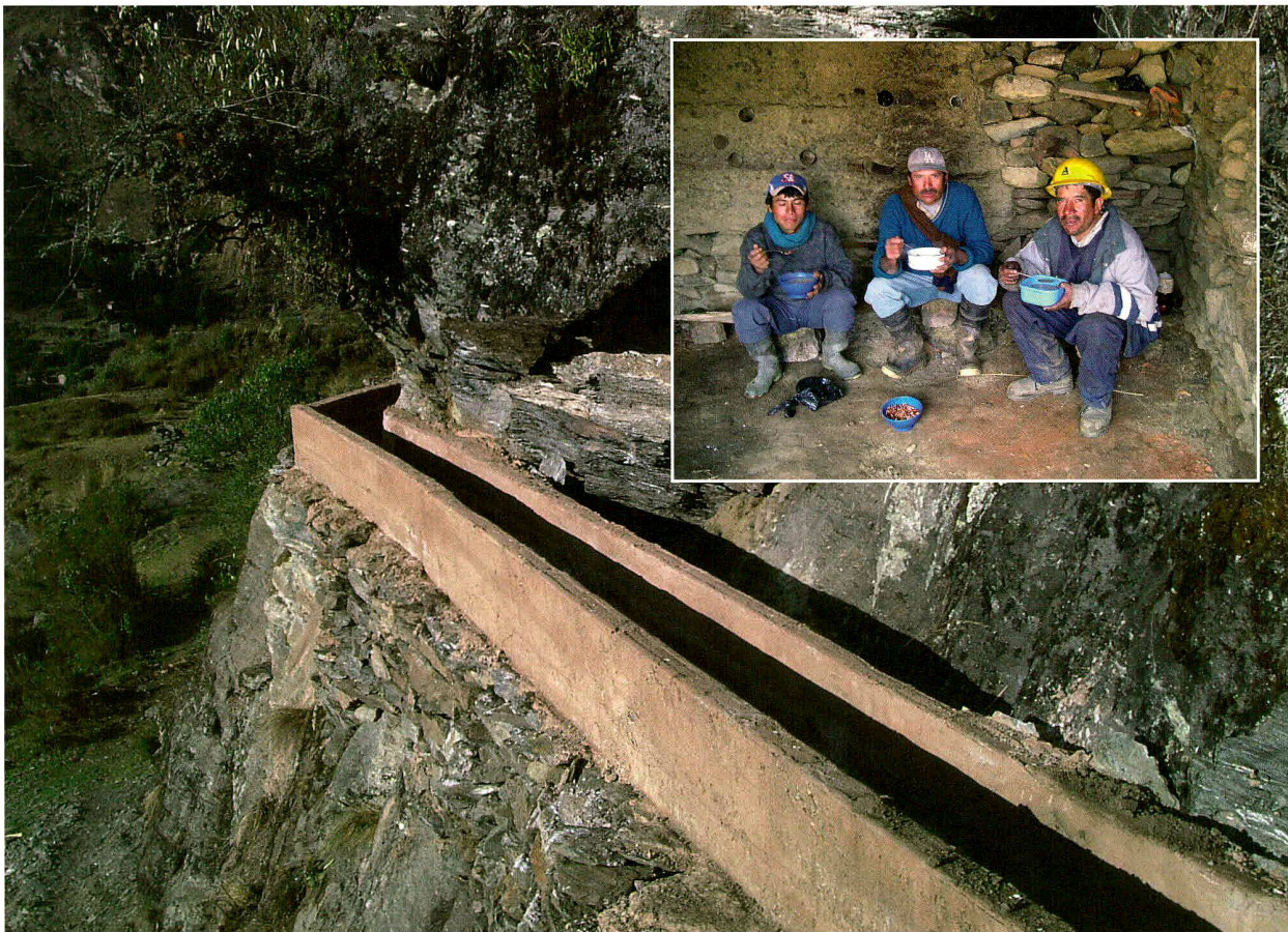
Peru (2005): Bau der Wasserleitung vom Bergsee zum Dorf Uco; Projektpartner: Mission Don Bosco (Italien).