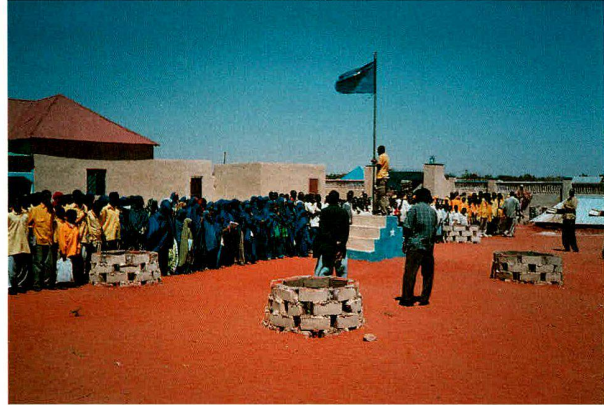
Somalia (2007): Einweihung der Wasserversorgung im Spital von Abudwaak. Projektpartner: Hadia Medial Swiss Somalia (CH – Somalia).