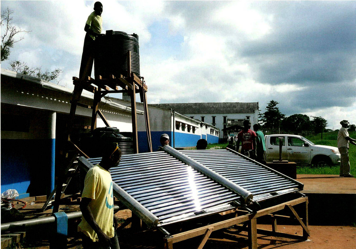
Mocambique (2011): Aufbau eines Swiss Wasserkiosks. Projektpartner: Fachhochschule Rapperswil (Schweiz).

Das nachhaltige Jubiläumsgeschenk der Georg Fischer AG zur 200-Jahr-Feier