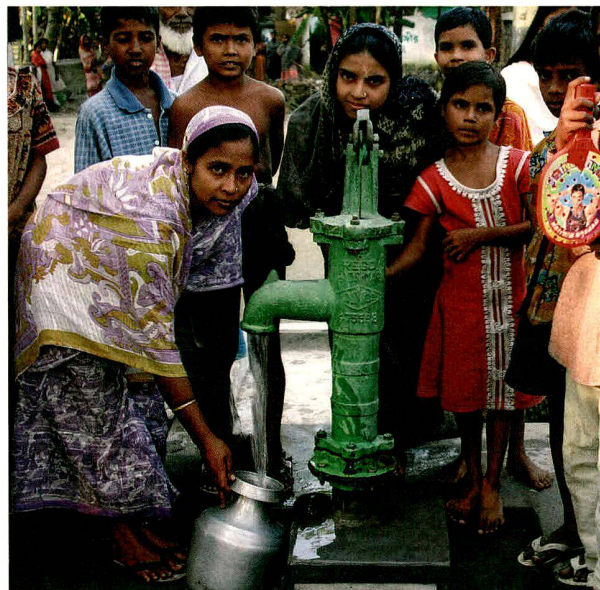
Indien (2007); Projektpartner: Mass Education (Indien).

Für alle drei Bilder: Vor allem die Frauen profitieren vom besseren Zugang zu Wasser, denn sie sind für die Versorgung der Familie mit Wasser verantwortlich.