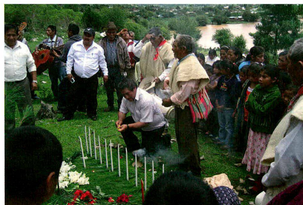
Mexiko (2011): Vorbereitungen für den Bau der Wasserleitung im Indianerdorf La Floresta. Projektpartner: Schweizerische Indianerhilfe SIH / ASI.