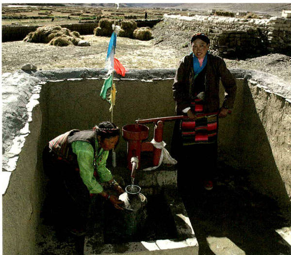
Dank der neuen Gemeinschaftswasserpumpe in Lhato gehören die kilometerweiten Fussmärsche zur nächsten Wasserstelle der Vergangenheit an.