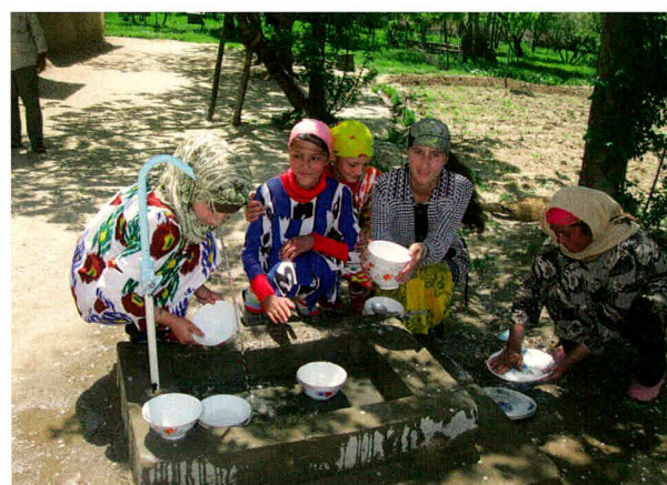
Tadschikistan (2010): Bau einer Trinkwasserversorgung für drei ländliche Dörfer; Projektpartner: Caritas Schweiz.