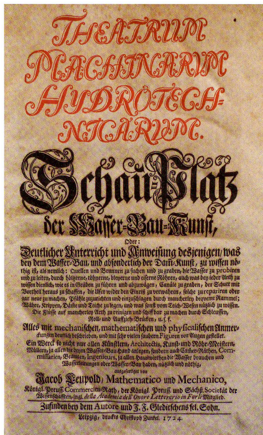
Titelblatt des «Theatrum Machinarum Hydrotechnicarum» von Jacob Leupold 1724.

Das «Theatrum» als technisches Werk wird im vorliegenden Aufsatz nach nichttechnischen Wissensbeständen befragt. Dies ist nur ein kleines Beispiel dafür, dass sich die technisch orientierten Bestände der Eisenbibliothek auch als Quelle für Fragestellungen nutzen lassen, die abseits der Technikgeschichte im engeren