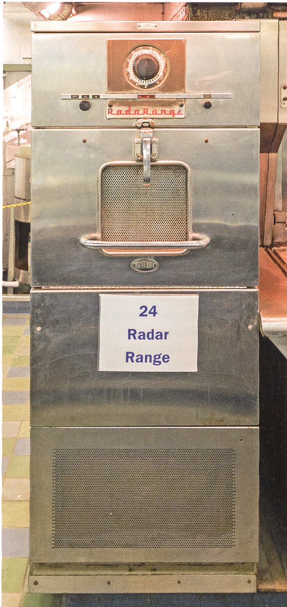
Mikrowellenherd Radarrange von 1947 in einer modernen Grossküche.