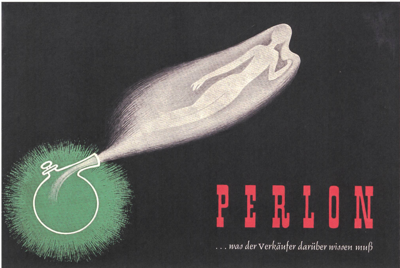
3 Der Geist aus der Flasche.

zunächst scheinbar harte, wissenschaftliche Fakten über die Genese der Chemiefasern. Allerdings entpuppte sich der Text auf den zweiten Blick als sagenhafte Geschichte über eine sogenannte «grossartige Erfindung», die mithilfe ihrer unermüdlichen Erfinder «reifen und wachsen» musste, um die Welt nun endlich zu «bereichern und zu verschönern». 23 Demnach erfüllten die Chemiefasern, die hier menschliche Züge erhalten, nicht nur eine wirtschaftliche, sondern auch eine «hohe soziale Aufgabe». 24 Es ist unübersehbar, dass der Erzählduktus der klassischen Heldenreise folgt: Ausgangspunkt ist die Unzulänglichkeit der Welt des Helden; es folgen die Berufung und Prüfungen, die mithilfe von Mentoren gelöst werden. Der Held gewinnt dadurch neues Wissen, vereint dieses mit dem Alltag und befreit schliesslich die Welt aus dem Zustand des Mangels. In unseren Beispielen wechseln sich Erfinder und neuer Stoff in der Rolle des Helden ab.