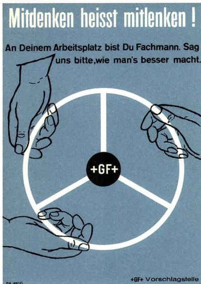
1 Werbung für das GF-Vorschlagswesen, ca. 1954–1956.

Quantifizierung der Kostenersparnis, die aus dem Ideenreichtum der Mitarbeitenden bei GF resultierte, – auch mangels Zahlen und Berechnungen in den Quellen – verzichtet. Pauschalisierungen wie «dank Vorschlagswesen Einsparungen von Millionen», die von der Schweizerischen Arbeitsgemeinschaft Vorschlagswesen (SAV) in den Jahren nach ihrer Gründung 1978 medienwirksam publiziert wurden, 2 steht die Autorin zurückhaltend gegenüber.