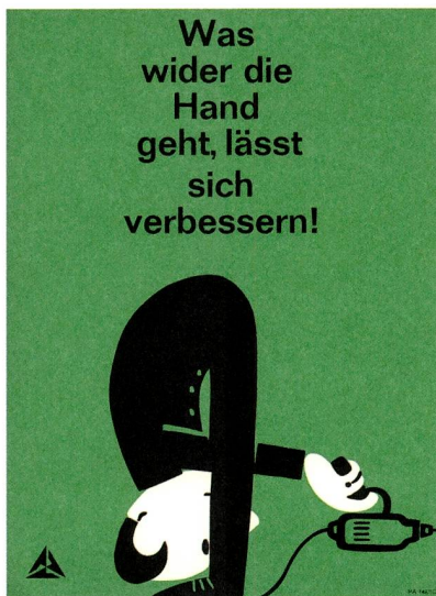
2 Werbung für das GF-Vorschlagswesen, ca. 1954–1956.

In den folgenden Jahren verschlechterte sich die Situation weiter. Ein Bericht von 1953 spricht von verhinderten Vorschlägen und Missbrauchsfällen: «Auf der anderen Seite sind Beispiele genannt worden, wo Betriebsinstanzen versuchen, die Arbeiter am Mitwirken zu hindern; [...] Es wurde festgestellt, dass in den verschiedenen GF Werken das Vorschlagswesen befriedigend bis gar nicht funktioniert, zum Teil nicht einmal bekannt ist. [...] Die schlimmste Möglichkeit, ebenfalls an Beispielen belegt, besteht darin, dass der Vorschlag eines Arbeiters als unbrauchbar abgelehnt, etwas später dann vom betreffenden Vorgesetzten selbst als sein geistiges Eigentum weitergegeben wird.» 27 Auch der Informationsfluss zwischen den verschiedenen Werken war unbefriedigend: «[Es] besteht zurzeit ein gänz-