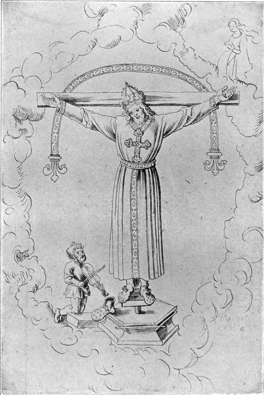
Aus Folioband U 3 der öffentl. Kunstsammlung zu Basel. (Vgl. oben S. 174).