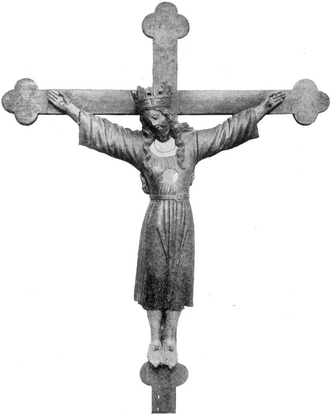
Kümmernis-Kreuz in Bürglen.