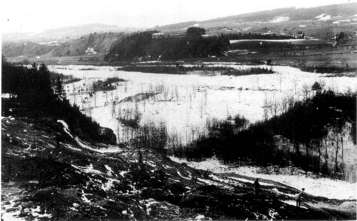
Abb. 4: Hochwasser der Sense mit Überschwemmung des Talbodens unterhalb Sensebrück um 1890.