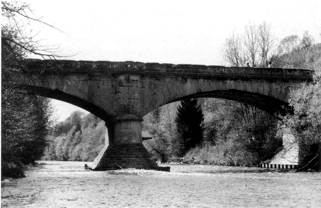
Abb. 3: Die dritte Steinbrücke von 1852–1854, zwischen Flamatt und Thörishaus, Zustand 1996.