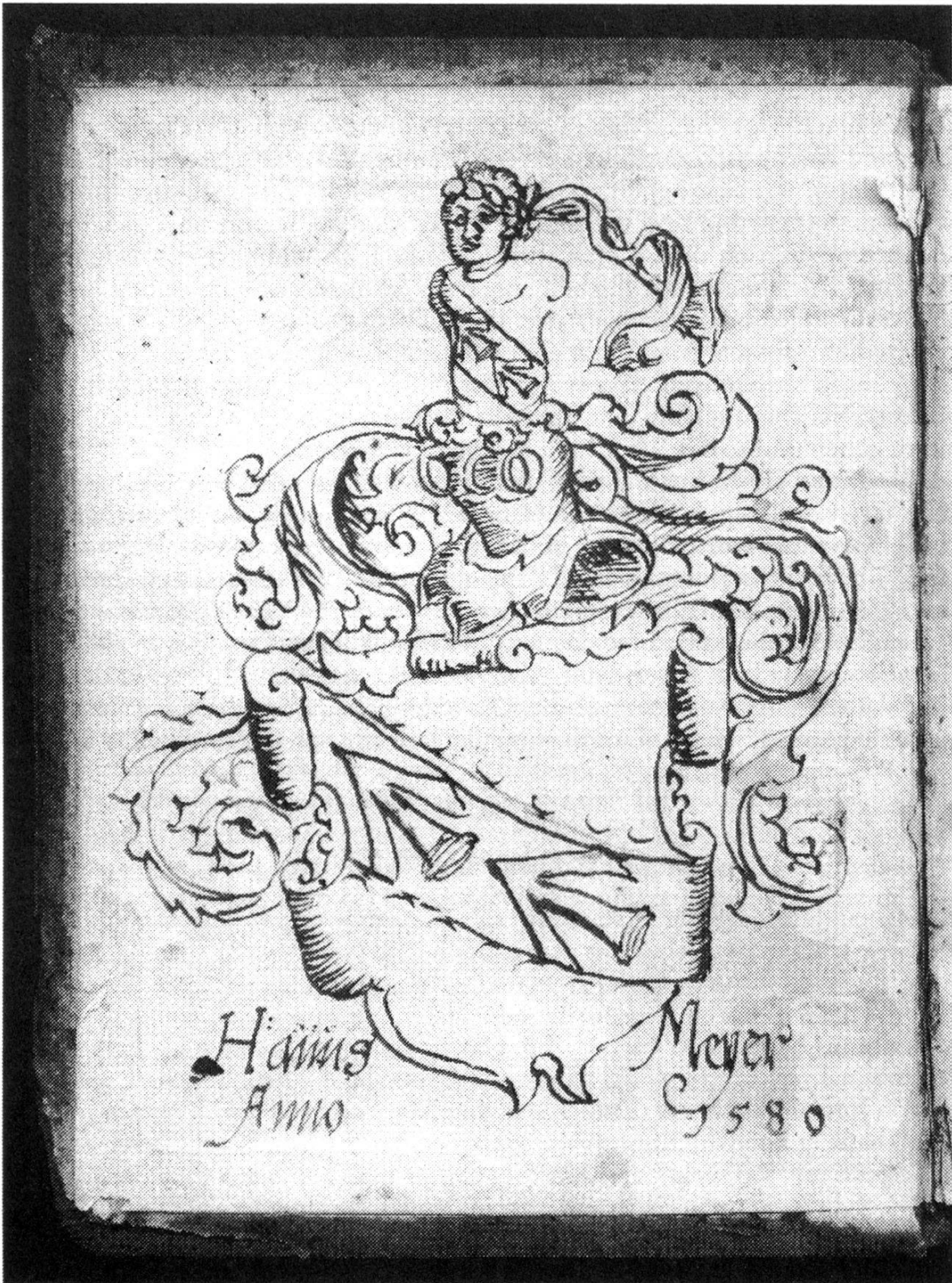
Abb. 1: Spiegelblatt (Originalgrösse 19,5 x 15 cm).