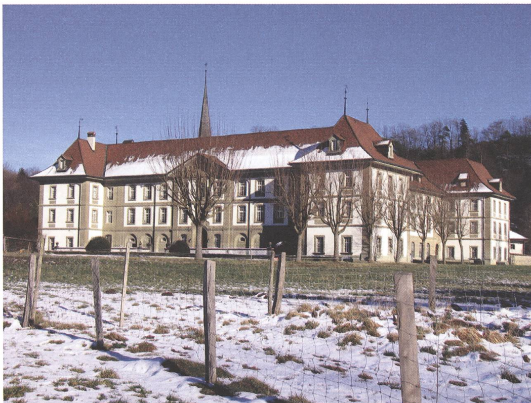
Abb. 2: Altenryf, damals Sitz des Lehrerseminars.