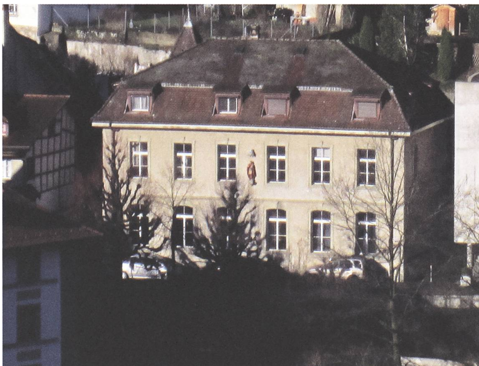
Abb. 4: Das Schulhaus in der Lenda vom «Petit Montreux» aus.