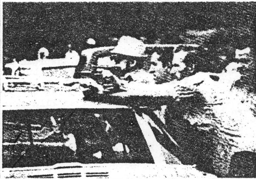
HARLAN COUNTY, USA von Barbara Kopple, USA