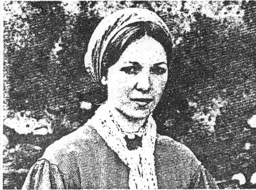
L'ALBERO DEGLI ZUCCOLI von Ermanno Olmi, Italien