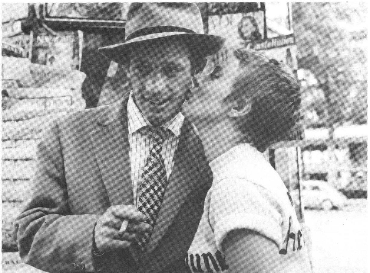
A BOUT DE SOUFFLE