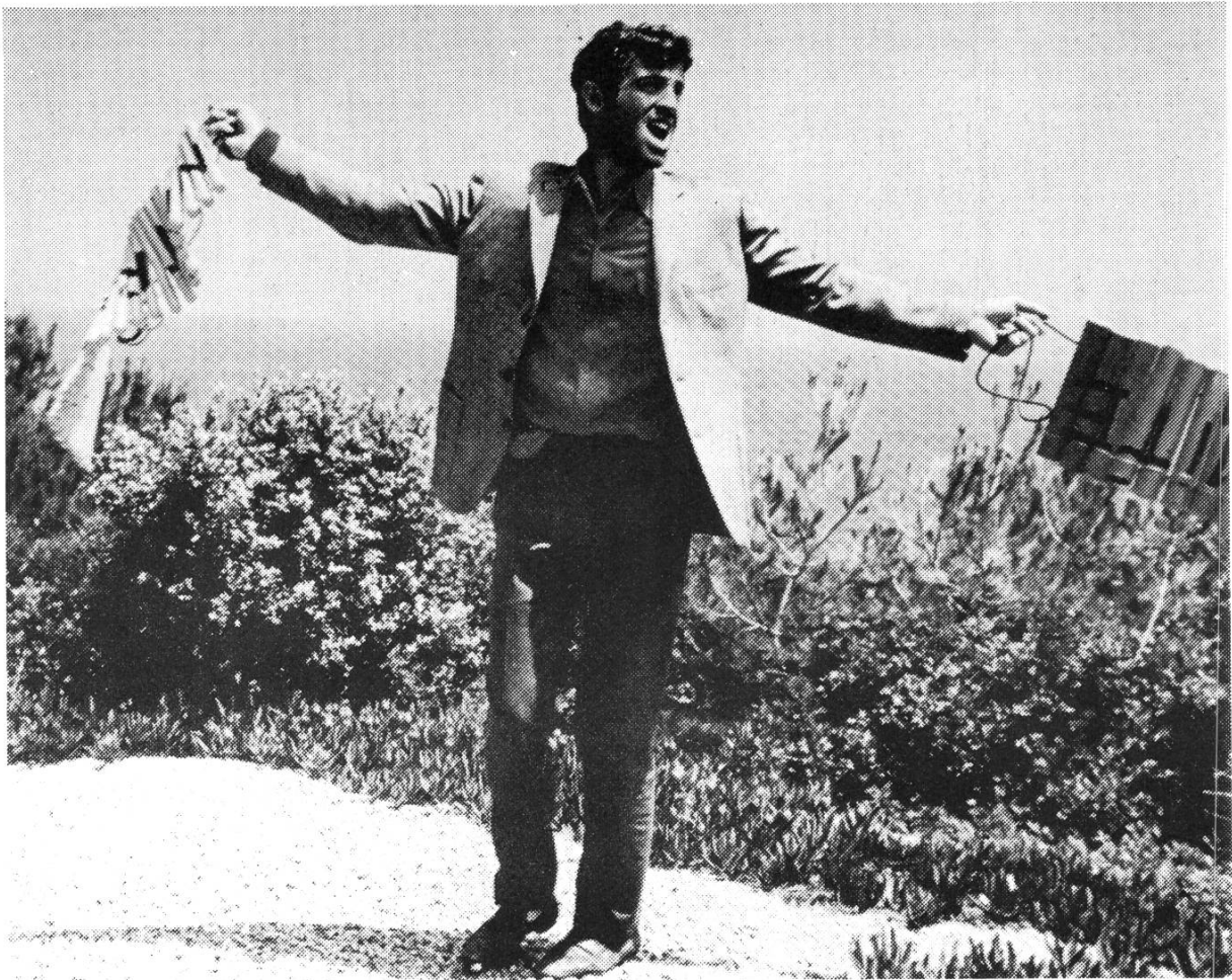
PIERROT LE FOU