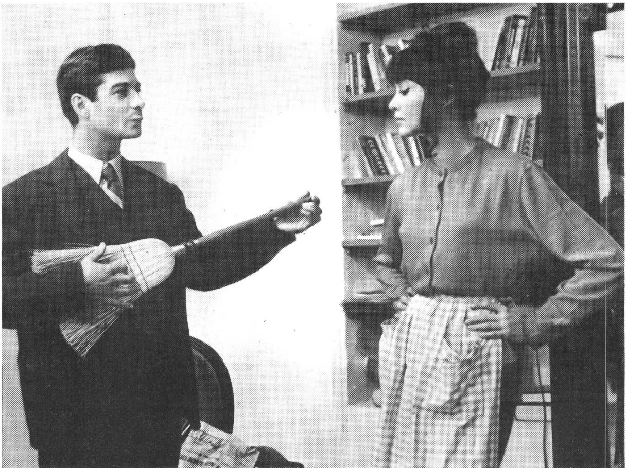
UNE FEMME EST UNE FEMME