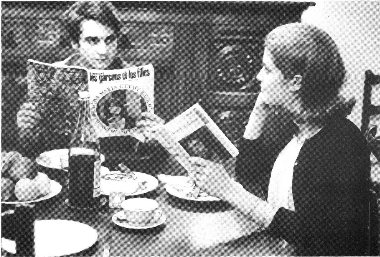
UNE FEMME EST UNE FEMME