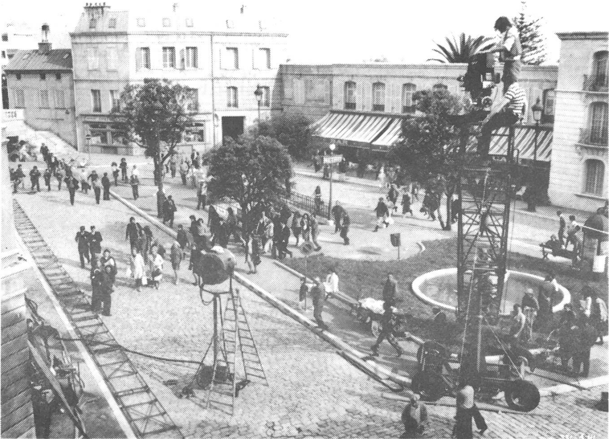
Drehplatz mit Dekor und Technik vor der Kamera