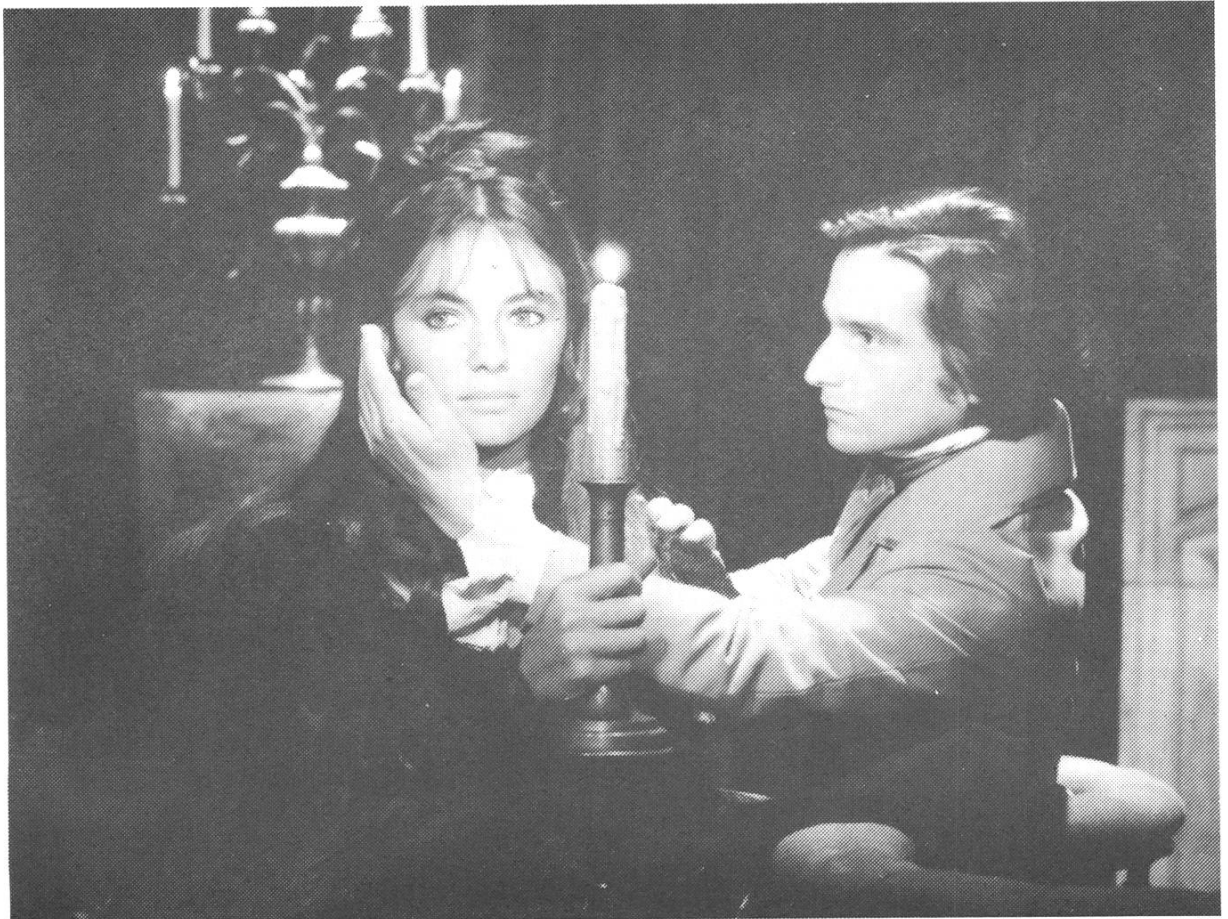
Film im Film vor der Kamera