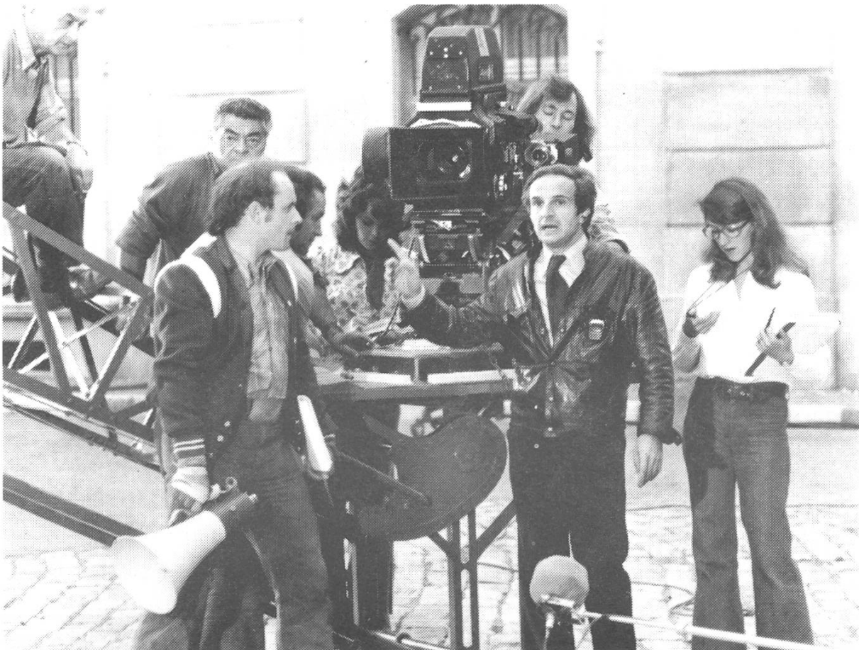
Kamera mit Schauspieler-Equipe vor der Kamera