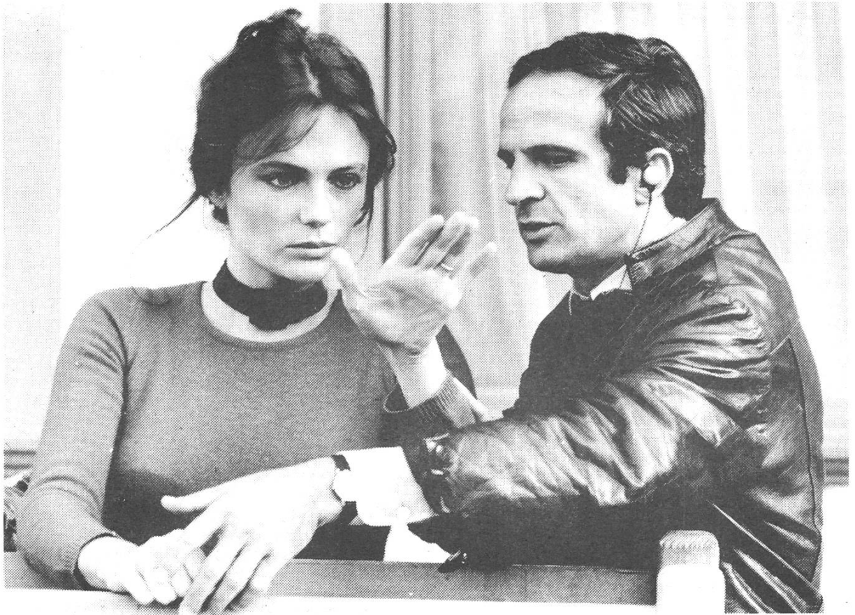
Inszenierung vor der Kamera