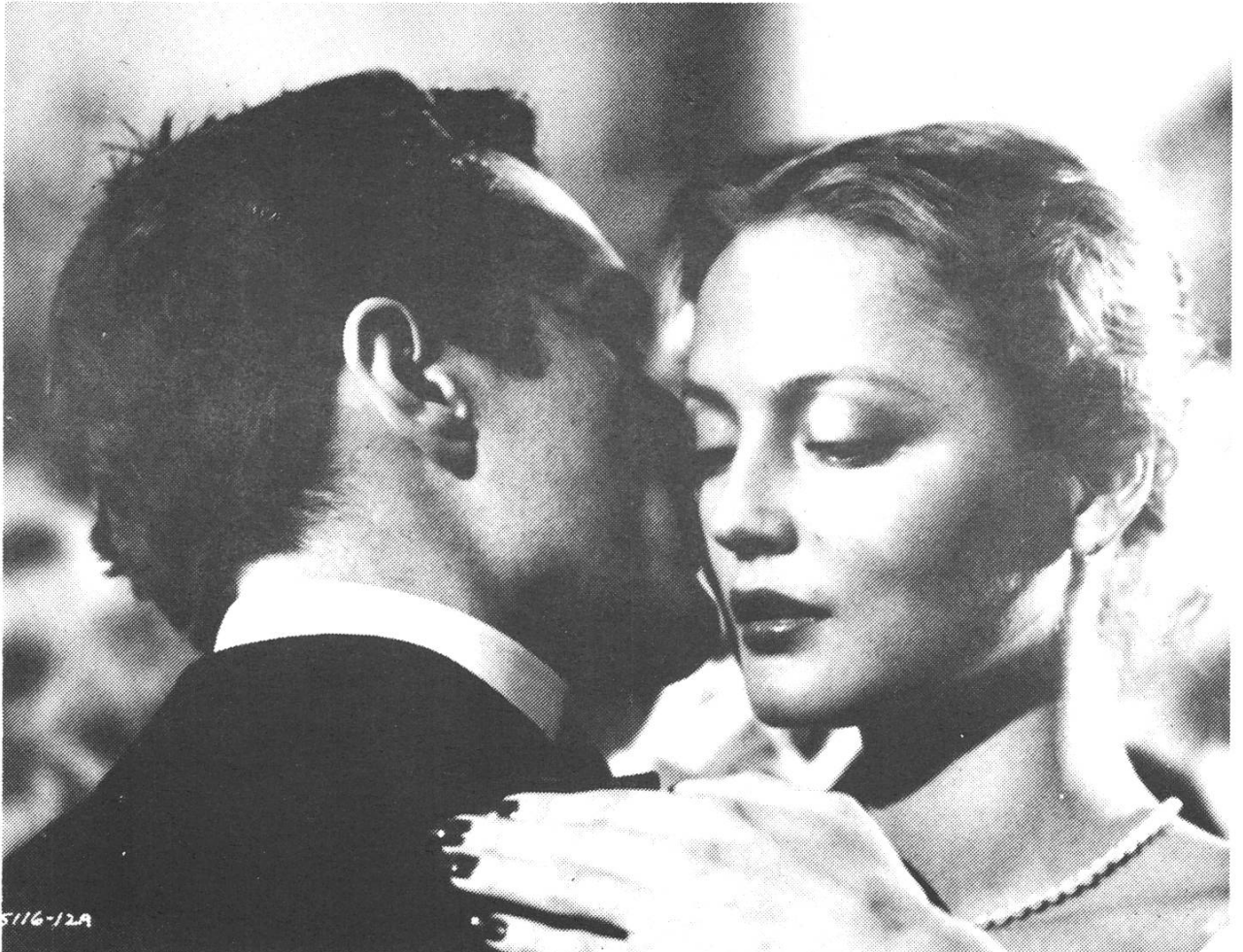
THE LAST TYCOON