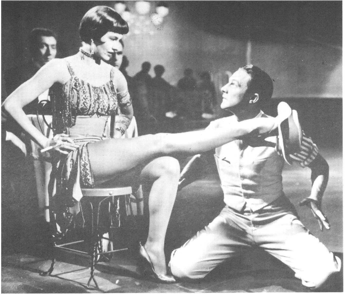
SINGIN' IN THE RAIN