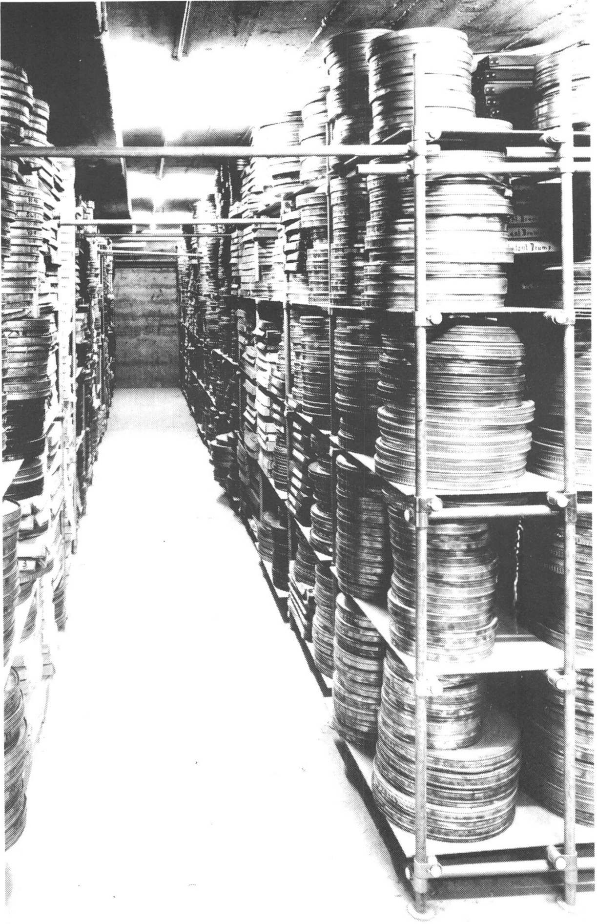
Blick in eines der diversen Filmlager der Cinémathèque Suisse