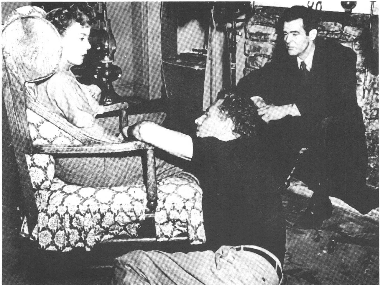
Nicholas Ray inszeniert Robert Ryan und Ida Lupino für ON DANGEROUS GROUND